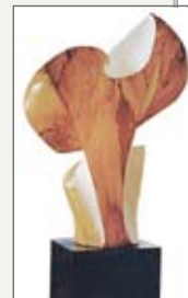
Klaus Wolf Simon Sculpturen

Sonntag, 3. Juli 2011 bis Sonntag, 17. Juli 2011