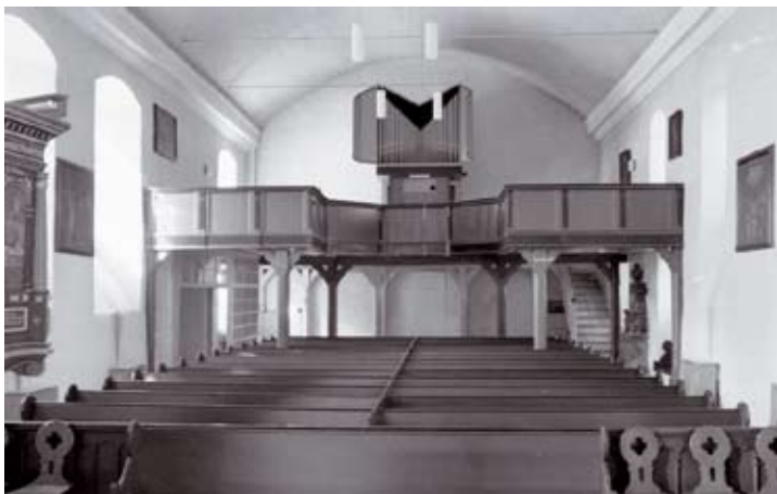
Kirchenschiff mit Empore und altem Gestühl

Das romanische Langhaus mag bis zum Ende des 17. Jh. erhalten geblieben sein. Zu dieser Zeit wurde das Schiff zwischen Chor und Turm abgebrochen und unter Verwendung der alten Steine neu aufgebaut. Die Fenster der Südseite sind von barocken Sandsteingewänden mit Kantenprofilierung umrahmt, Zwei Türen, im Süden und Norden, entsprechen im Rahmen den Fenstern; die Südtür trägt im Sturz die Datierung Anno 1712, die Nordtür Anno 1690.