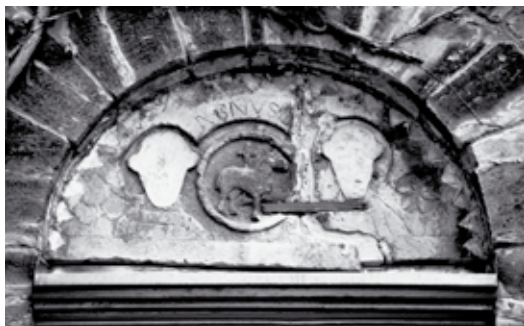
Tympanon über der Eingangstür zum Turm

Gleich über der Turmtür fällt das leider sehr zerstörte Tympanon auf. Der Bruch ist sicher auf eine Setzung des Turmes zurückzuführen, während das Abschleifen der Portraits wohl erst im 20. Jh. vorgenommen wurde. Trotzdem bleibt das Tympanon beachtenswert, als einwichtiges Zeugnis kirchlicher Symbolik des 12. Jh. Zwischen den Portraits der beiden Heiligen ist das Gotteslamm (Agnus Dei) fast unzerstört sichtbar. Neben den weiteren Ornamenten - Rosette, Blätterzweig - ist der umlaufende Zackenkranz bemerkenswert, wie er auch an der Idenser Kirche erscheint.